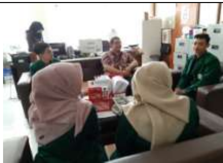
Foto berpamitan dengan kepala bappeda