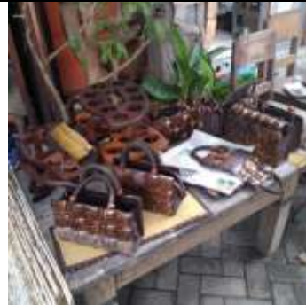
Hasil jadi kerajinan kampung batok