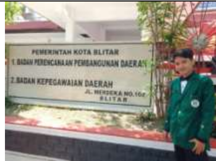
Depan kantor bappeda kota Blitar