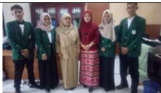
Kunjungan Dosen Pembimbing Lapangan saat pembukaan Praktikum Pengalaman Lapangan