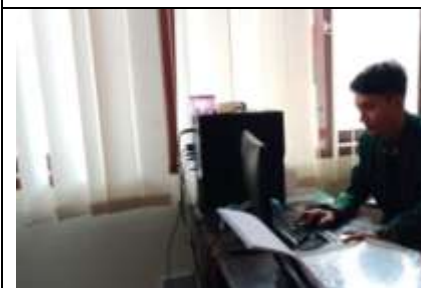
Mengerjakan tugas-tugas yang diberikan oleh Pembimbing dan staf pegawai lainnya, seperti mencari referensi untuk kajian litbang menginput SKP menyusun buku kajian dan maste