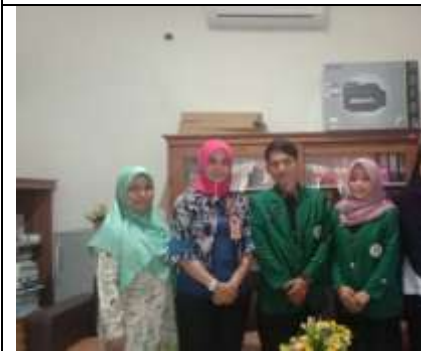
Foto bersama semua pegawai bid anglitbang