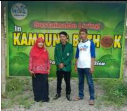
Kunjungan ke Kampung Batok